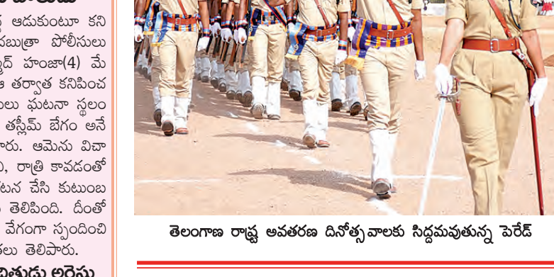
తెలంగాణ రాష్ట్ర అవతరణ దినోత్సవాలకు సిద్ధమవుతున్న పోలీస్