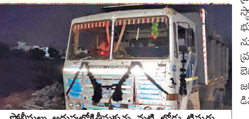
పోలీసులు అదుపులోకి తీసుకున్న మట్టి లోడు టిప్పర్

అక్కడ అక్రమంగా మట్టి తవ్వకం జరుగుతున్న విషయాన్ని గమనించి, తవ్వకాలకు ఉపయోగిస్తున్న రెండు జేసీబీలను, మట్టిని తరలిస్తున్న మూడు టిప్పర్లను స్వాధీనం చేసుకున్నారు. పట్టుబడిన విదు వాహనాలను మండల తహసీల్దార్ కార్యాలయానికి తరలించిపట్టు సిబ్బంది తెలిపారు. అయోకనతో స్థానికులు తహసీల్దార్ కార్యాలయానికి కూతవేలు దూరంలోనే ఉన్న ప్రభుత్వ భూముల్లో ఇంత దర్జాగా అక్రమ తవ్వకాలు జరగడంపై స్థానికులు తీవ్ర ఆభ్యంతరం వ్యక్తం చేస్తున్నారు. ప్రభుత్వ భూములలో పాలు చెరువులు, కుటుంబ కూడా మట్టి దళారుల నుంచి రక్షణ కరువైందని వారు ఆవేదన వ్యక్తం చేస్తున్నారు. ప్రభుత్వ సంపదను దోచుకుంటూ, ప్రశ్నించిన వారిని బెదిరింపులకు గురిచేస్తున్న మట్టి మాఫియాపై సమగ్ర విచారణ జరిపి చట్టపరమైన కఠిన చర్యలు తీసుకోవాలని స్థానికులు డిమాండ్ చేస్తున్నారు. ఈ వ్యవహారంపై ఇప్పటికే ఉన్నతాధికారులకు నవీదక చేరింది. సోమవారం (రేపు) అక్రమంగా పట్టురట్టు కఠిన చర్యలు తీసుకునే అవకాశం ఉందని రెవెన్యూ సిబ్బంది పేర్కొన్నారు.