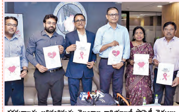
కరవత్రాలను అవిష్కరిస్తున్న తెలంగాణ కార్మికులతో సాఫ్ట్ వైద్యులు

జాషీదాబాద్, మే 31, ప్రభాతవార్త: ప్రపంచ పాగాకు నిరోధక దినోత్సవం సందర్భంగా తెలంగాణ కార్మికులందరికీ సాఫ్ట్ అడ్వర్టైజ్మెంట్ అధికారుల అవగాహన కార్యక్రమం నిర్వహించారు. పాగాకు కలలను వంపుతుంది అనే అంశంతో ఈ ఏడాది నివాసం తీసుకున్నట్లు తెలిపారు. ఈ సందర్భంగా డిప్యూటీ సబ్ ఇన్స్పెక్టర్ ఆఫ్ పబ్లిక్ రిలేషన్స్ మాట్లాడుతూ యువతను లక్ష్యంగా చేసుకుని అకర్మణ్యంగా ప్యాకెటింగ్, రుసుము, సోషల్ మీడియా ప్రచారాల ద్వారా పాగాకు, సిగరెట్ల ఉత్పత్తులను ప్రోత్సహించడం ఆధునికీకరమన్నారు. పాగాకు కాణడంగా ప్రపంచ వ్యాప్తంగా ప్రతి సంవత్సరం 80 లక్షల మందికి పైగా ప్రాణాలు కోల్పోతున్నారని, గుండె జబ్బులు, క్యాన్సర్, స్ట్రోక్, శ్వాసకోశ రుగ్మతులకు ఇది ప్రధాన కారణమని తెలిపారు. పాగాకు వినియోగంతో యువత మరణం ఉండాలని, పాగాకు నియంత్రణ చట్టాలను కట్టుదిట్టంగా అమలుచేయాలని, విన్నూలను నికోటిన్ వ్యవసాయం నుంచి రక్షించాలని అవసరం ఉందని ఆయన పిలుపు విచ్చూరు. ఈ సందర్భంగా పాగాకును వ్యతిరేకంగా రూపొందించిన కరవత్రాలను వైద్యులు అవిష్కరించారు.