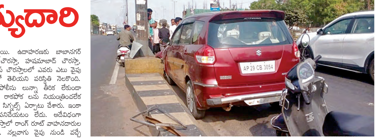
చాంద్రాయణగుట్ట డీఎల్ఆర్ వద్ద ఆటోబి సైన్ బోర్డు పిల్లర్లు డిక్లార్ చేసిన కారు