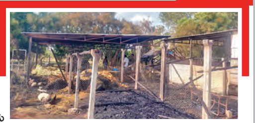
అగ్నిప్రమాదానికి దగ్గమైన పశువులు పెడె ఆధికారులకు ఫిర్యాదు చేసినా..

ఫిర్యాదు చేసినా ఎలాంటి చర్యలు తీసుకోలేదని బాధితులు ఆరోపిస్తున్నారు. అధికారులు ముందస్తు చర్యలు తీసుకుని ఉంటే ఈ ప్రమాదం జరిగేది కాదని గ్రామస్థులు ఆగ్రహం వ్యక్తం చేస్తున్నారు.