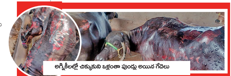
అగ్నికేలల్లో చిక్కకుని ఒక్కండా పుండ్లు అయిన గేదెలు

మొయినాబాద్, మే 31 ప్రభాతవార్త: మొయినాబాద్ పోలీస్ స్టేషన్ పరిధిలోని చందానగర్ గ్రామంలో ఆదివారం మధ్యాహ్నం భారీ అగ్నిప్రమాదం సంభవించింది. విద్యుత్ తీగలు ఒకదానికొకటి రాకెట్ల వాళ్ళే సర్వగ్రాహీ ఏర్పడటంతో వెలరెగిన మంటలు ఒక గేదెల పెట్టుపై పడటంతో ఈ ప్రమాదం జరిగింది. ఈ దుర్ఘటనలో మూడు దూడలు అక్కడిక్కడే మృతి చెందగా, పది గేదెలు తీవ్రంగా గాయపడ్డాయి. పెడెతో పాటు పక్కనే నిలిపి ఉంచిన ట్రాక్టర్ కూడా పూర్తిగా కాలి బూడిదైంది. ఈ ఘటనతో చందానగర్ గ్రామంలో తీవ్ర విషాదం ఛాయలు అలుముకున్నాయి.