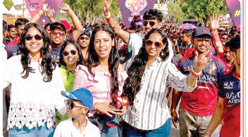
మరికొన్ని చోట్ల కొందరు ముందుగానే ఫైనల్ మ్యాచ్ చూసేందుకు తమ బేటులు బుక్ చేసుకోవడం గమనార్హం. ధోనిపాత్రయిన రవాణారులు...

ఉప్పల్, మే 31 (ప్రభాతవార్త) : రాయల్ చాలెంజర్స్ బెంగళూరు, గుజరాత్ టైటాన్స్ జట్ల మధ్య జరుగుతున్న ఐపిఎల్ ఫైనల్ మ్యాచ్ పీవర్ నగరాన్ని తాకింది. నగరంలోని పలుచోట్ల దుకాణాలు, ఈవెంట్ సంస్థలు, పబ్లు, బార్లు వద్ద భారీ స్ట్రీట్ లు ఏర్పాటు చేసి క్రికెట్ మ్యాచ్ ప్రదర్శించారు. రాయల్ చాలెంజర్స్ బెంగళూరు, గుజరాత్ టైటాన్స్ జట్ల మధ్య జరుగుతున్న ఈ మ్యాచ్ ఎంతో ఆసక్తికరంగా మారింది. ఈ ఏడాది ఐపిఎల్ సీజన్ విజేతను తెల్పే ఫైనల్ మ్యాచ్ అవ్వడానికే వేదికగా ఆదివారం రాత్రి 7.30 గంటలకు ప్రారంభం అయింది. అవ్వడానికే లోని నరేంద్ర మోడి స్టేడియం వేదికగా జరుగుతున్న తుది ఫోరులో రెండు బలమైన జట్లు ఉండడంతో క్రీడాకారులు ఆసక్తికరంగా టీవీలకు ఆసక్తికరమయ్యారు. ఇటు సైన్స్ రిపోర్ మైదానం కావడం... అటు కింగ్ దూకుడు మీద ఉండడంతో రెండో కప్పి ఎవరి సొంతమవుతుందనేది ఆసక్తికరంగా మారింది. వీధుల్లో ఇక్కడ అత్యుత్సవ గణాంకాలే ఉన్నాయి. మరీ ముఖ్యంగా కావాలే మ్యాచ్ లో కోట్లాది గీట్ ఉత్సవం ఆసక్తికరమయ్యారు. నగరంలోని అన్ని ప్రధాన కూడళ్ల వద్ద క్రికెట్ మ్యాచ్ కారణంగా ట్రాఫిక్ రద్దీ తక్కువగా కనిపించింది. కొందరు క్రికెట్ ప్రేక్షకుల కోసం ప్రత్యేకంగా స్ట్రీట్ లు ఏర్పాటు చేశారు. కొందరు మధ్యం త్రయలు కోసం కూడా భారీ స్ట్రీట్ లు ఏర్పాటు చేసి కళ్లపర్యటన ఆకట్టుకున్నారు.