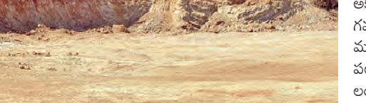
మూడుచింతలపల్లిలోని ప్రభుత్వ భూమిలో మట్టి తవ్వకాలు జరిపిన దృశ్యం

విదు వాహనాలు సీజ్ శామీరపేట, మే 31 ప్రభాతవార్త: మేధ్యల్ మల్కాజిగిరి జిల్లా మూడుచింతలపల్లి మండల కేంద్రంలో మట్టి మాఫియా రెచ్చి పోతోంది. అధికారుల కళ్ళ గవ్వ రాత్రి సమయాల్లో ప్రభుత్వ భూములను యధేచ్ఛగా తవ్వేస్తూ సొమ్ము చేసుకుంటోంది. తాజాగా శనివారం అద్దెరాత్రి ప్రభుత్వ భూమిలో అక్రమంగా మట్టి తవ్వకాలు జరుపుతుండగా రెవెన్యూ అధికారులు దాడి చేసి, భారీగా వాహనాలను సీజ్ చేశారు. స్థానికులపై బెదింపులు మూడుచింతలపల్లిలోని శాలవాని కులకు సమీపంలో ఉన్న ప్రభుత్వ భూమిలో పెద్ద ఎత్తున జేసేబీలు, టిప్పర్లు పెట్టి అక్రమంగా మట్టిని తరలిస్తున్నారు. అద్దెరాత్రి వేళ వాహనాల రాకపోకలు, జేసేబీల శబ్దాలు రావడంతో స్థానికులు అక్కడికి చేరుకుని మట్టి తవ్వకాలను అడ్డుకనే ప్రయత్నం చేశారు. అయితే, మట్టి దళారులు ఏమాత్రం వెనక్కి తగ్గకుండా... ఏం చేసుకుంటారో చేసుకోండి అంటూ స్థానికులను తీవ్రంగా బెదిరించారు. రంగారెడ్డికి దిగిన రెవెన్యూ సిబ్బంది దళారుల బెదిరింపులతో స్థానికులు వెంటనే మండల రెవెన్యూ