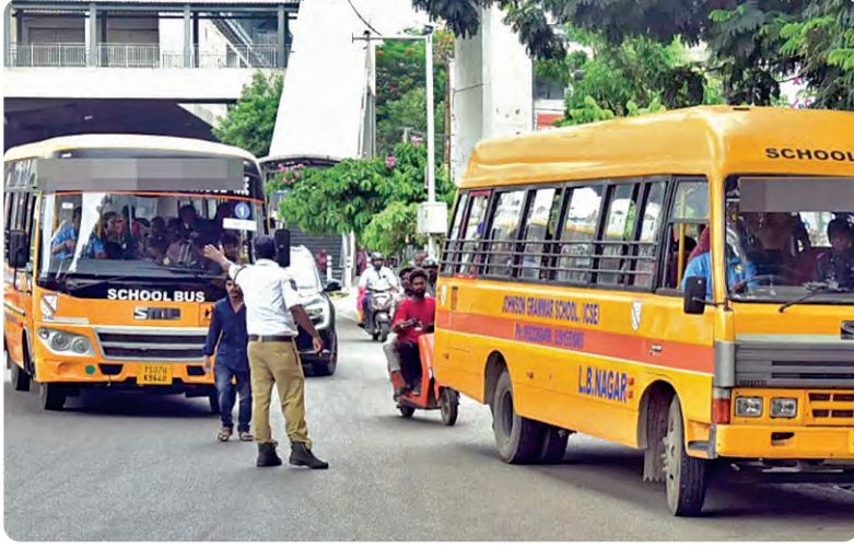
అధికారులు తెలిపారు. నిబంధనలు ఉల్లంఘిస్తే బస్సులు సీజ్...

హైదరాబాద్, మే 31, ప్రభాతవార్త బడులు తిరిగి తెరుచుకోవడానికి సామర్థ్యం ఉన్న బస్సులను అందుబాటులో ఉంచడానికే నిబంధన ఉంది. మరో 11 రోజుల్లో బడిగంట మోగనున్న నేపథ్యంలో పూర్తిస్థాయిలో స్కూల్ బస్సులు ఫిట్‌అప్‌కు రాకపోవడం గమనార్హం. ఏటా మే 15వ తేదీ నుంచి బస్సుల సామర్థ్య పరీక్షలు కొనసాగుతాయి. ఆ రోజు నుంచి జూన్ మొదటి వారం వరకు రవాణా అధికారులు పరీక్షలు నిర్వహించి వాటి సామర్థ్యాన్ని నిర్ధారించిన తర్వాతే పిల్లలకు రవాణా సదుపాయాన్ని అందజేసేందుకు ఆ బస్సులకు అనుమతి లభిస్తుంది. ఏటా మే 15వ తేదీ నుంచి బస్సుల సామర్థ్య పరీక్షలు కొనసాగుతాయి. ఆ రోజు నుంచి జూన్ మొదటి వారం వరకు రవాణా అధికారులు పరీక్షలు నిర్వహించి వాటి సామర్థ్యాన్ని నిర్ధారించిన తర్వాతే పిల్లలకు రవాణా సదుపాయాన్ని అందజేసేందుకు ఆ బస్సులకు అనుమతి లభిస్తుంది. ఏటా మే 15వ తేదీ నుంచి బస్సుల సామర్థ్య పరీక్షలు కొనసాగుతాయి. ఆ రోజు నుంచి జూన్ మొదటి వారం వరకు రవాణా అధికారులు పరీక్షలు నిర్వహించి వాటి సామర్థ్యాన్ని నిర్ధారించిన తర్వాతే పిల్లలకు రవాణా సదుపాయాన్ని అందజేసేందుకు ఆ బస్సులకు అనుమతి లభిస్తుంది.